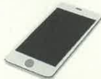
マイナンバーカード読取対応 のスマートフォン